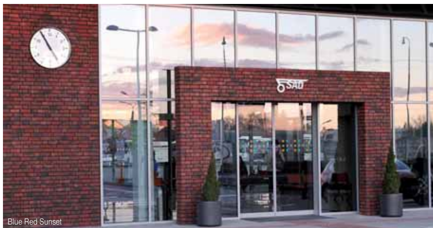
Blue Red Sunset

Polyfunkčná budova v Bratislave (pri Hoteli Hilton)