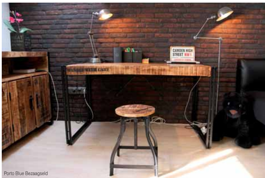
Porto Blue Bezaagseld

Všetky lícové obklady a tehly sú predovšetkým vyrobené a určené na použitie do exteriéru ale samozrejme nič nebráni tomu aby ste tehličky použili v interiéri. V dnešnej dobe je využívanie spomínaných tehál v interiéroch dokonca veľmi rozšírené a architekti ich často a radi používajú pre dekoráciu rôznych miestností a to nielen v budovách väčšieho rozsahu, ale i pre spríjemnenie a zútulnenie vnútorných priestorov klasických rodinných domov, či bytových priestorov. Možnosti sú nekonečné, hranicou je jedine Vaša fantázia.